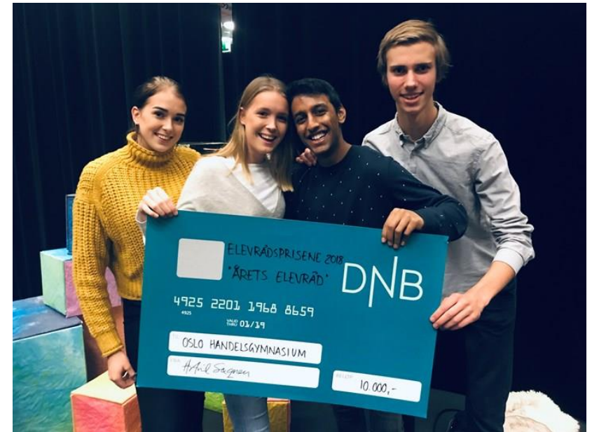
Årets elevråd 2018!