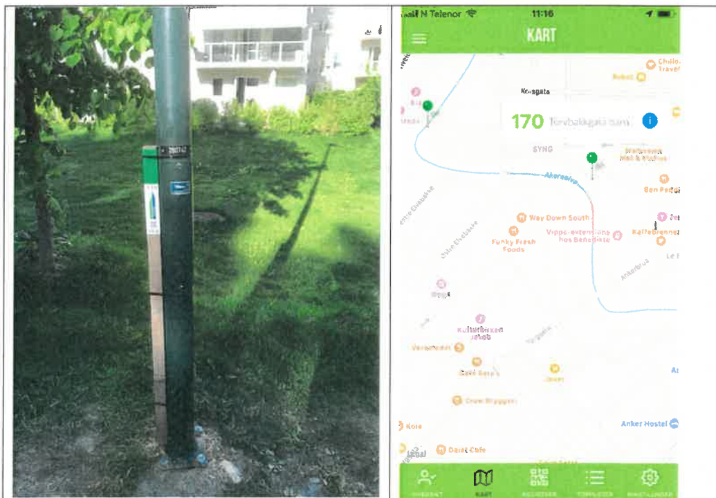
Slik ser stolpene ut