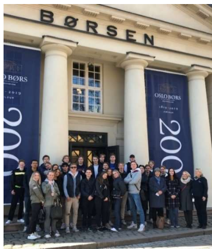
Skolebesøk på Oslo Børs. Vi er ofte ute på besøk hos ulike institusjoner og bedrifter.

Samfunnsøkonomi gir deg også innsikt i hvordan våre levetilstander er avhengig av samspillet mellom aktørene i økonomien, hva som påvirker dette samspillet, og hvordan myndighetenes økonomiske politikk får betydning for både næringslivet og oss alle.