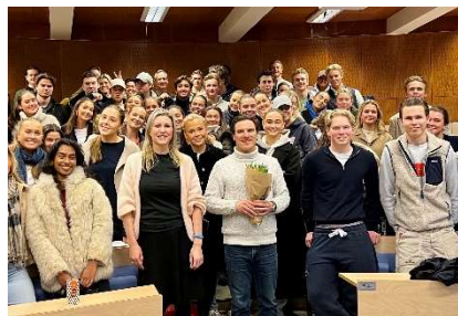
Bedriftsbesøk fra Swims

Målgruppe: Faget for deg som er interessert i business, salg, sosiale medier, forbruk og samfunn, bærekraft, og kanskje også liker å jobbe litt kreativt.