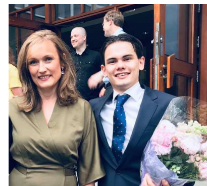
Med kåring av beste elev...